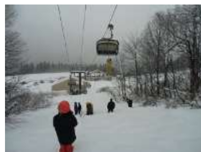
「九頭竜スキー場との合同救助訓練」