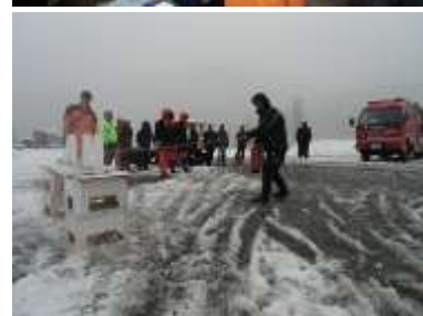
「冬期従業員研修会」